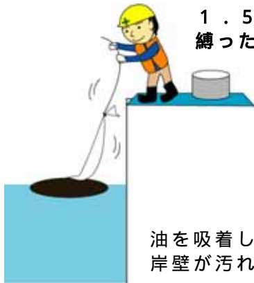
1.5mくらいの長さに切った油吸着マットをロープで縛ったもので油を吸着

もっと手軽に使用する場合には長尺型油吸着マットを1.5mくらいの長さに切り、その一端にロープを縛っておき、このロープの端を持ったまま岸壁等の上から海面に投げれば、油の吸着と吸着後の油吸着マットの回収が簡単にできます。岸壁等から届くような区域に浮流している少量の油の回収にはこの方法で対応してはいかがでしょうか。