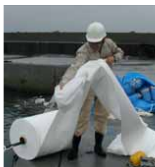
長尺型油吸着マットの端を縛ったり、カッターで切断すれば必要な長さの油吸着マットを作ることが可能