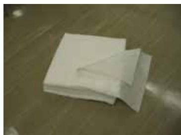
油吸着材と聞くと、まず頭に浮かぶのはシート型油吸着マット？

油吸着材と聞くとまず頭に浮かぶのは座布団のような形をしたシート型油吸着マットではないでしょうか？しかし、シート型は風の影響を受け狙った場所に命中しにくく回収も困難です。また、油吸着後のシート型は海面の油と同じ色になり、回収できずテトラポッドの中に入り込んだり、流されてのり柵等の漁場に入れば二次汚染源となってしまいます。