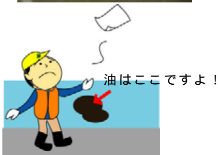
風に飛ばされるシート型 狙った場所に命中しにくい・・・