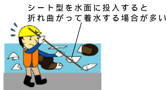
散乱するシート型 油と見分けが付かなくなったシート型 回収困難・・・

そこで、便利なのが長尺型油吸着マット（ロール型油吸着マットとも言う）です。長尺型油吸着マットの端末を縛ったロープを保持し、もう一方を他の作業員が持って展張すれば、油吸着マットでの油吸着と油吸着マットの回収が一度にできます。また、カッターで切ったり、端と端を結んだりすれば最適な長さの油吸着マットを作ることができます（6.5mロール型の連結は2個までなら可能です）。