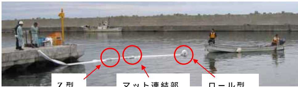
陸上および船上の作業員が長尺型油吸着マットの両端を持って海に展張

もっと手軽に使用する場合には長尺型油吸着マットを1.5mくらいの長さに切り、その一端にロープを縛っておき、このロープの端を持ったまま岸壁等の上から海面に投げれば、油の吸着と吸着後の油吸着マットの回収が簡単にできます。岸壁等から届くような区域に浮流している少量の油の回収にはこの方法で対応してはいかがでしょうか。