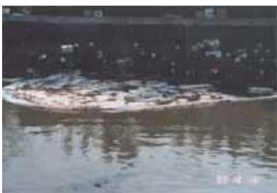
水面に散乱したシート型を長尺型で包囲し引き寄せました。

一般にシート型油吸着マットが普及していますが、海面での使用にあたっては長尺型油吸着マットやオイルフェンスで囲んだ中でのみ使用し、必ず全量を回収することが重要です。全量回収が困難な場合は海面での使用を避けるかロープをつないで万国旗型にする方法があります。ただし、万国旗型は風で個々のシート型がバラバラになり、ここから油が漏れるおそれがあります。