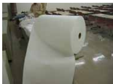
とても便利な長尺型（ロール型）油吸着マット

そこで、便利なのが長尺型油吸着マット（ロール型油吸着マットとも言う）です。長尺型油吸着マットの端末を縛ったロープを保持し、もう一方を他の作業員が持って展張すれば、油吸着マットでの油吸着と油吸着マットの回収が一度にできます。また、カッターで切ったり、端と端を結んだりすれば最適な長さの油吸着マットを作ることができます（6.5mロール型の連結は2個までなら可能です）。