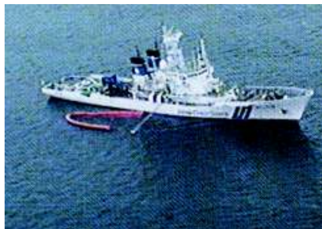
「大型真空式油回収装置」運用中の巡視船えりも

また、本訓練では漁場油濁被害救済基金が研究開発した「(小型)簡易流出油回収装置」を網走漁協所属漁船に設置し運用訓練を実施しました。