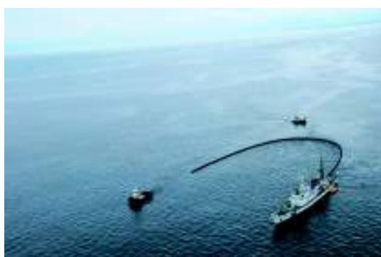
「中型油回収装置」油回収訓練（Jフォーメーション） （巡視船そらち、作業船益栄丸）