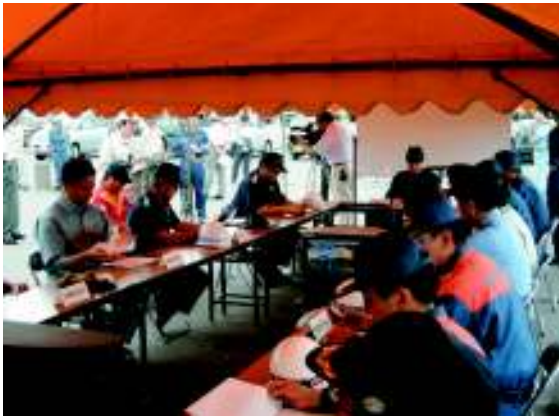
災害対策現地合同本部での会議

また、本訓練では各機関情報共有のため、海上保安庁函館航空基地所属ヘリコプターくまたか等により撮影した映像を現地合同本部のモニター及び訓練会場に設置した大型スクリーンに映し出しました。