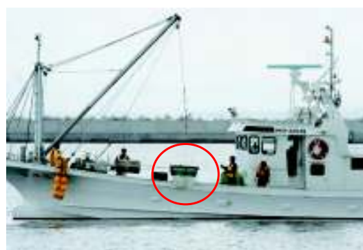
「(小型)簡易流出油回収装置」運用中の網走漁協 所属漁船