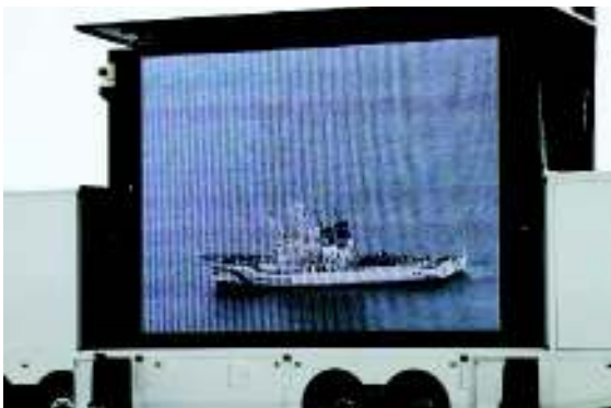
訓練会場に設置した大型スクリーンに映し出された洋上での訓練状況