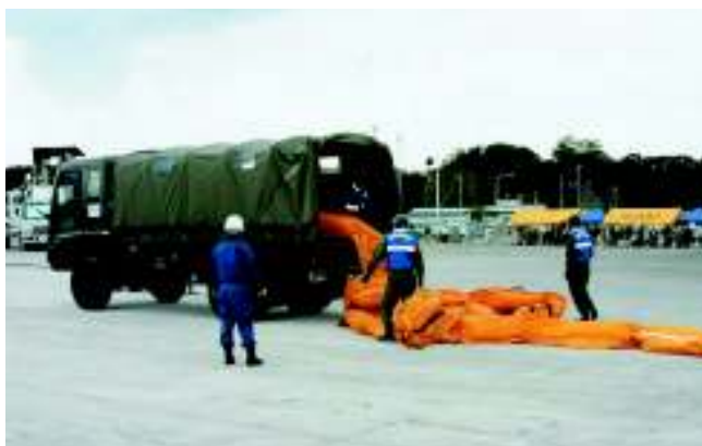
自衛隊によるオイルフェンスの輸送訓練

災害派遣要請を受けた自衛隊員により、オイルフェンスの輸送訓練を行い、その後、網走地区沿岸排出油等災害対策協議会会員によりオイルフェンスを港内に展張しました。