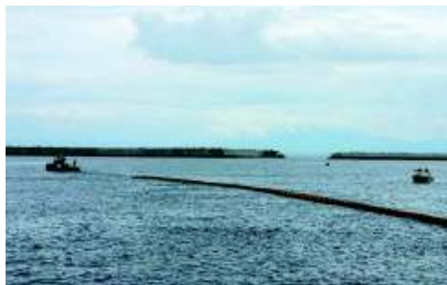
オイルフェンス展張訓練