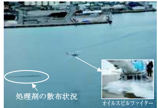
ヘリコプターによる油処理剤の空中散布