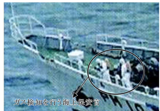
巡視船そらちによる海上ガス検知