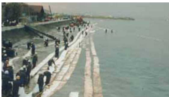
長尺型油吸着マットを8条展張し、漂着油を防除

長尺型油吸着マット等が風浪で砂浜に打ち上げられても、その場所で油の防除回収に役立ちます。